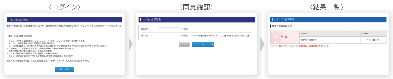
※図はイメージであり、実際の画面とは異なる場合があります。